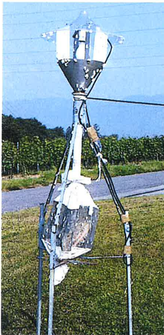
Lors de fortes pullulations, la quantité de papillons est telle que de nombreux individus sont encore visibles le matin autour du piège lumineux.