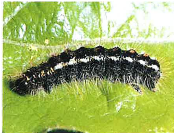
La chenille mature hérissée de poils urticants mesure de 30 à 33 mm.

présence de fortes populations de bombyx peut occasionner de l'urtication chez les personnes travaillant dans les vergers, particulièrement à la récolte. Les cueilleurs grattent alors les cueilleuses et réciproquement. Finalement tous y prennent beaucoup de plaisir si bien que les travaux accusent un retard considérable. Une intervention avec un insecticide à action rapide (ester phosphorique ou Bacillus thuringiensis ) peut alors s'avérer nécessaire en été. En présence de faibles populations ou sur des plantes ornementales, il est possible de procéder à un échenillage en hiver en prenant soin d'éviter tout contact direct avec les nids qui doivent être brûlés.