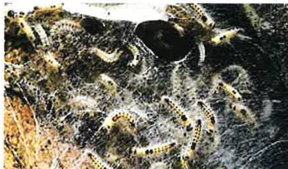
Chenilles au stade L2 sur le nid avant l'hivernage.

En cultures fruitières, pratiquement tous les insecticides appliqués en traitement pré- ou postfloral contre les arpeuteuses et les noctuelles sont également efficaces contre les larves du bombyx cul brun qui reprennent leur activité après l'hibernation. En été par contre, les jeunes larves fraîchement écloses échappent parfois aux programmes sélectifs appliqués contre les tordeuses. Même si les défoliations sont peu importantes, la