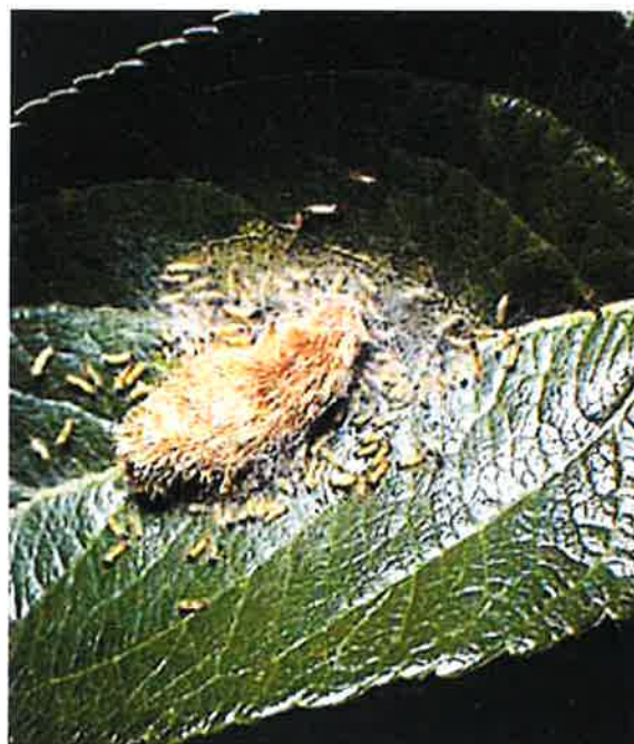
Dès l'éclosion, les jeunes chenilles sortent de l'amas feutré qui protège les œufs et s'attaquent aux feuilles.