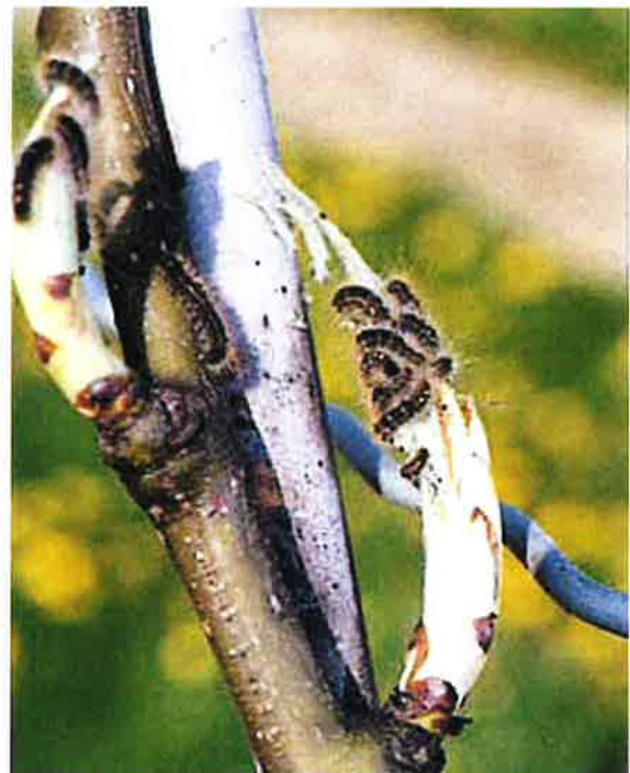
Chenilles attaquant des bourgeons de poirier