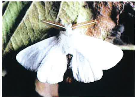
Papillon mâle du Bombyx cul brun Euproctis chrysoorrhoea .

Ce ravageur n'a qu'une génération par année. Les papillons sont nocturnes et volent en juin-juillet. Les œufs, déposés dans un amas de poils que la femelle détache de son abdomen, éclosent après environ 8 jours d'incubation. Après s'être nourries un certain temps, les petites chenilles entrent en hibernation et passent la mauvaise saison dans des nids formés de feuilles sèches agglomérées par de la soie. Elles reprennent leur activité au printemps dès que les températures atteignent 10 à 15° C. Elles se nourrissent