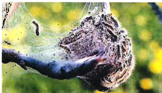
Au printemps, les chenilles quittent le nid soyeux chaque matin et y retournent le soir.

Elaboré par Agroscope RAC et FAW Wädenswil